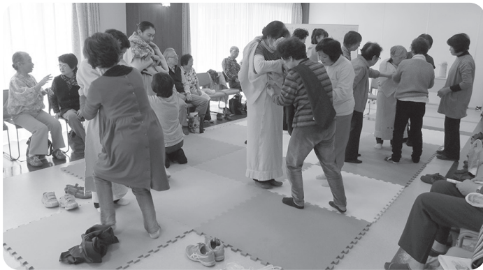
タオルケットや毛布を使ったガウン 寒いとき、体全体を包み込んで保温します