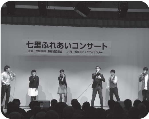
埼玉大学 アカペラサークル

昔懐かしい曲「お嫁において」「真つ赤な太陽」「カナダからの手紙」「おお、シャンゼリゼ」などを若者らしく元気に歌ってくれました。