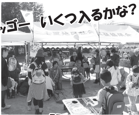
バックー いくつ入るかな?