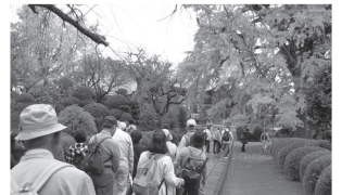
圓蔵院の銀杏 樹齢4百年