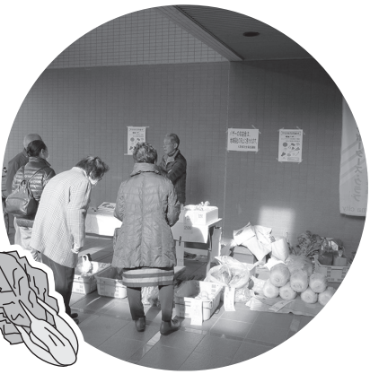
新鮮大谷産野菜です！