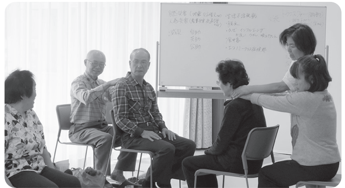
リラクゼーション 温かい手の温もりが伝わり癒されます