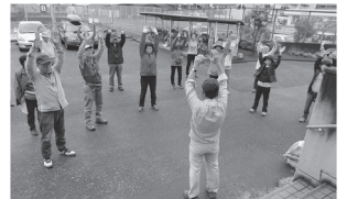
出発前の準備体操

合併記念見沼公園で昼食をとっていると土砂降りの雨となり帰路を心配しましたが、集合時間になると雨も上がり、見沼弁財天宗像神社、正法院、十王尊の大イチョウを見学しました。参加した皆さんは、近くにこんな文化財や公園があることを知っている人も少なく、大変いい発見ができたと言っていました。