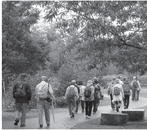
合併記念見沼公園

中川地区の紅葉を堪能しながら中川神社、圓蔵院の大イチョウ、みぬま見聞館、合併記念見沼公園を見学しました。