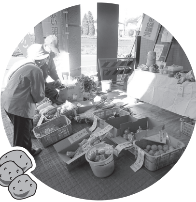
安心無農薬野菜ですよ！