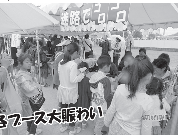
各ブース大賑わい