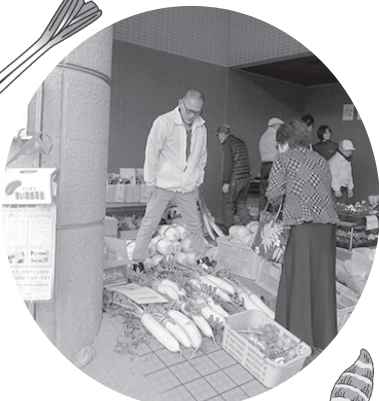
安心無農薬野菜ですよ