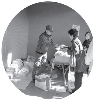
新鮮な大谷産野菜です