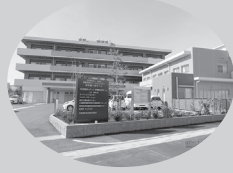
敬寿園七里ホーム