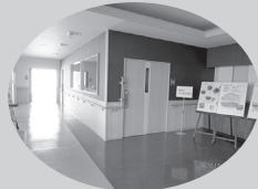
社協事務所入り口