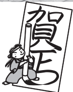
小学3年生から中学3年生まで参加