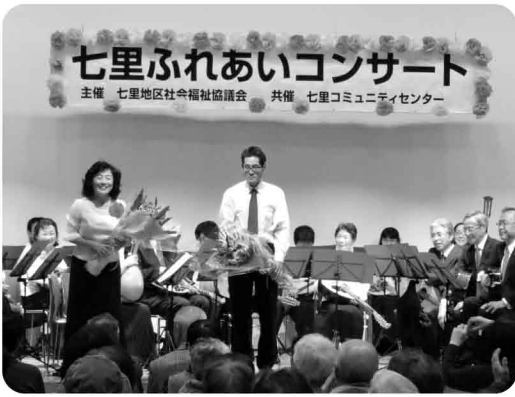
すばらしい選曲に感動しました。

「オリブの首飾り」「ロシアより愛をこめて」などの映画音楽の名曲の数々の演奏から始まり、宮崎アニメ「日本の秋の唄メドレー」、大河ドラマ「八重の桜」のテーマ曲、歌劇「椿姫」序曲、クリスマスソング、最後には、リズム溢れるラテンメドレーまで、お話を交えながら参加者の心に響く演奏に、皆さん感動していました。