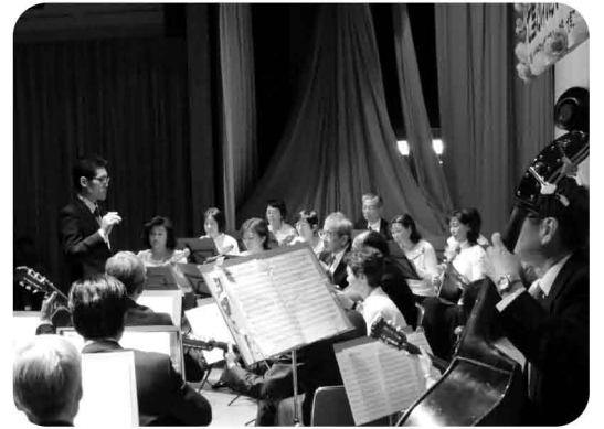
やさしい音色で 心が穏やかになりますネ！