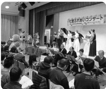
ふるさと 今日の日さようならを台唱

当日は、地元野菜の販売と募金が行われました。 コンサート当日の 募金額 9,715円 野菜販売収益金 8,400円 ご協力ありがとうございました。